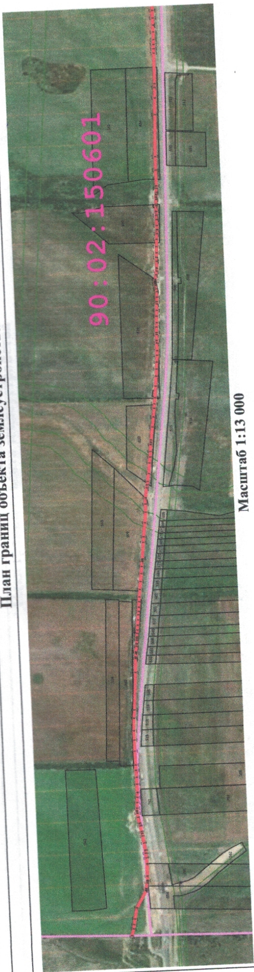
Масштаб 1:13 000